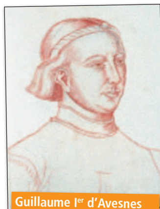
Guillaume 1er d'Avesnes