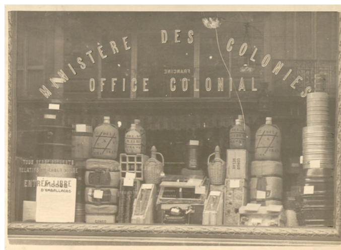
AGR2, Fonds Bibliothèque du ministère des Colonies, Office colonial (s.d.)

Ruanda-Urundi, documents relatifs au budget ou au recrutement d'agents et fonctionnaires coloniaux, tous ces papiers et bien d'autres sont conservés par le service d'archives du ministère des Colonies avant d'être transférés au « Service des Archives africaines » fondé au sein du ministère des Affaires étrangères en 1962. Mais le cœur des archives coloniales réside dans les archives produites au Congo belge et au Ruanda-Urundi. Ces documents ont principalement été conservés par les institutions productrices elles-mêmes, jusqu'à ce que les autorités locales adoptent une politique archivistique. C'est chose faite en 1957, lorsqu'elles optent pour une réplique du modèle métropolitain avec un dépôt central dans la capitale congolaise et un dépôt par